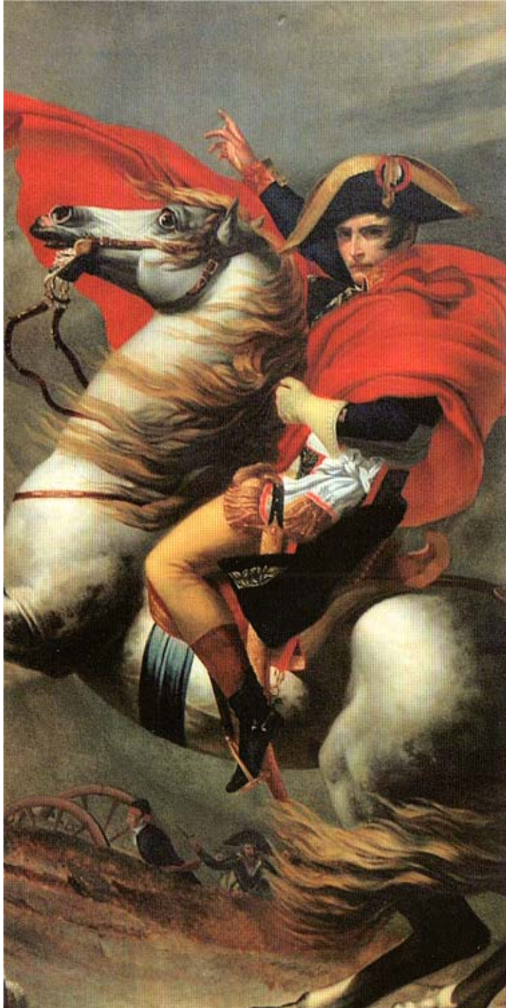
Extrait du tableau « Le Premier Consul Bonaparte franchissant les Alpes au col du Grand-Saint-Bernard »